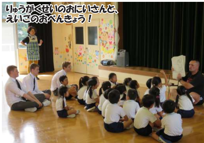
いっしょに英語のあそびをしよう！

辺りにはコスモスやヒガ ンバナが一面に咲き誇り、 さわやかな季節を迎え、例 年より早い秋の訪れを感じ ています。