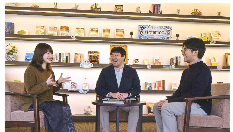
共生図書館 カフェスタイルスペースにて

佐藤 樹徳での6年間は学力だけでなく、ものの見方や精神性も鍛えられる場だと思います。そのため、どんなイベントでも精一杯取り組み、また仲間達と精一杯楽しんでほしいです。校歌にもある「夢は大きく、根は深く」の精神で卒業後の大きな夢を叶えるために、樹徳での6年間で根っこの部分を育んでもらいたいです。そのために、先生方を良い意味で「上手く利用」してください。先生方は皆さんの味方です。ぜひ実りある6年間を！！